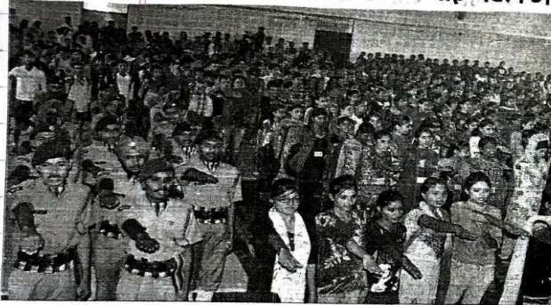
राजकीय स्नातकोत्तर महाविद्यालय में राष्ट्रीय एकता दिवस पर आयोजित कार्यक्रम में शपथ ग्रहण करते विद्यार्थी।

में उत्साह से मनाई गई सरदार वल्लभ भाई पटेल जयंती, प्रतिमा के समक्ष पृष्प अर्पित किए