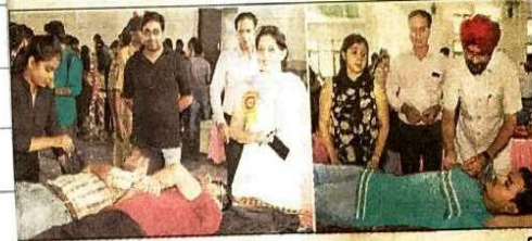
रक्तदाताओं का होसला बढ़ाती प्राचार्य व अन्य। (वर्मा)