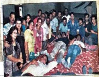
शिविर में रक्तदान करने वाले जे.सी.आई. व कालेज छात्रों को सम्मानित करते अतिथिगण। (बंदगोहन)